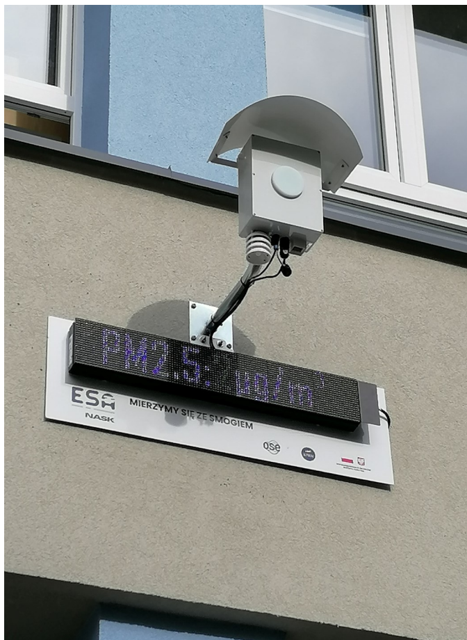
Czujnik pomiaru czystości powietrza zamontowany na budynku szkoły.

Zanieczyszczone powietrze to bardzo poważny problem. Wielokrotnie zadajemy sobie pytanie: co to jest smog? jak powstaje i jak z nim walczyć? Spróbujmy na nie odpowiedzieć.