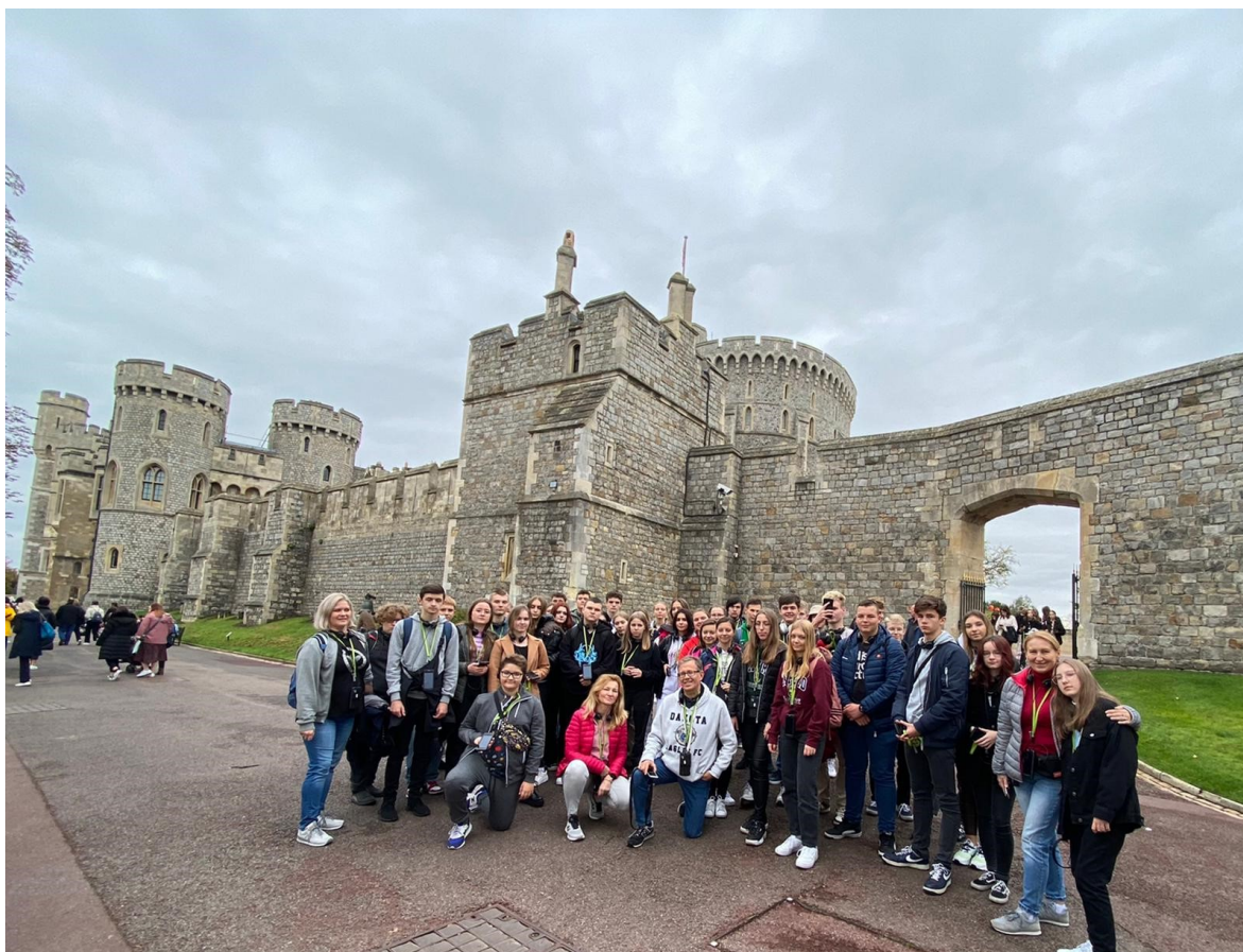
Pamiątkowe zdjęcie uczestników wycieczki.

Podczas ostatniego dnia naszego pobytu w Londynie przemieszczaliśmy się londyńskim metrem, podmiejską koleją i autobusami double-decker. Rano zwiedzaliśmy słynną twierdzę the Tower of London, następnie spacerowaliśmy przez most zwodzony Tower Bridge i wzdłuż rzeki Tamiza, odbyliśmy tzw. Queen’s walk, udaliśmy się na King’s Cross Station oraz peron 9 i 3/4. Na koniec odwiedziliśmy stadion Arsenal. Wieczorem, pełni wrażeń, rozpoczęliśmy drogę powrotną do domu. Wycieczka była wspaniała!!!”