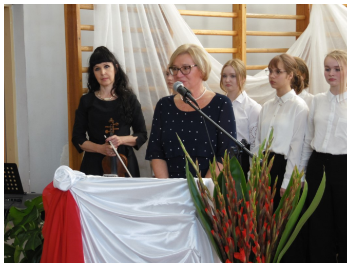
Zdjęcia z uroczystej akademii.