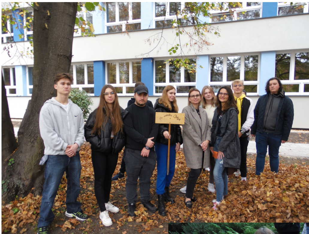
Członkowie MRS w szkolnym ogrodzie.

To już kolejna taka akcja, w poprzednich latach kopczyki miały swoich lokatorów :)