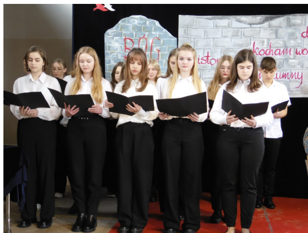
Zdjęcia z akademii.