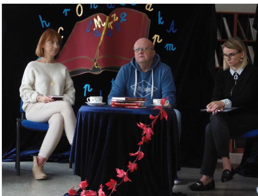
Nauczyciele VIII LOS czytają ulubione utwory.

https://www.youtube.com/watch?v=x_99du0xg6M