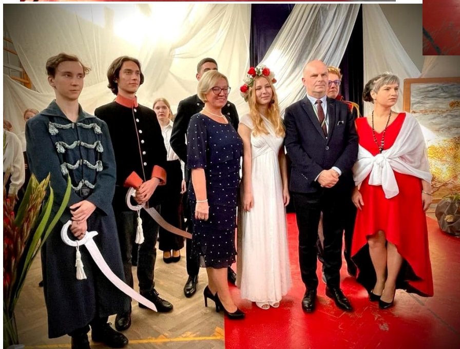
Zdjęcia z uroczystej akademii.