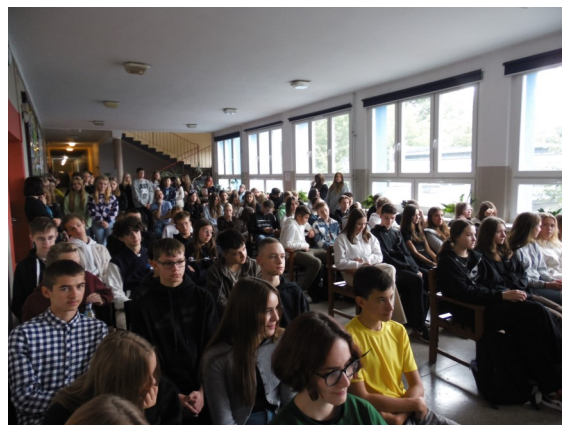
Narodowe Czytanie w VIII LOS.