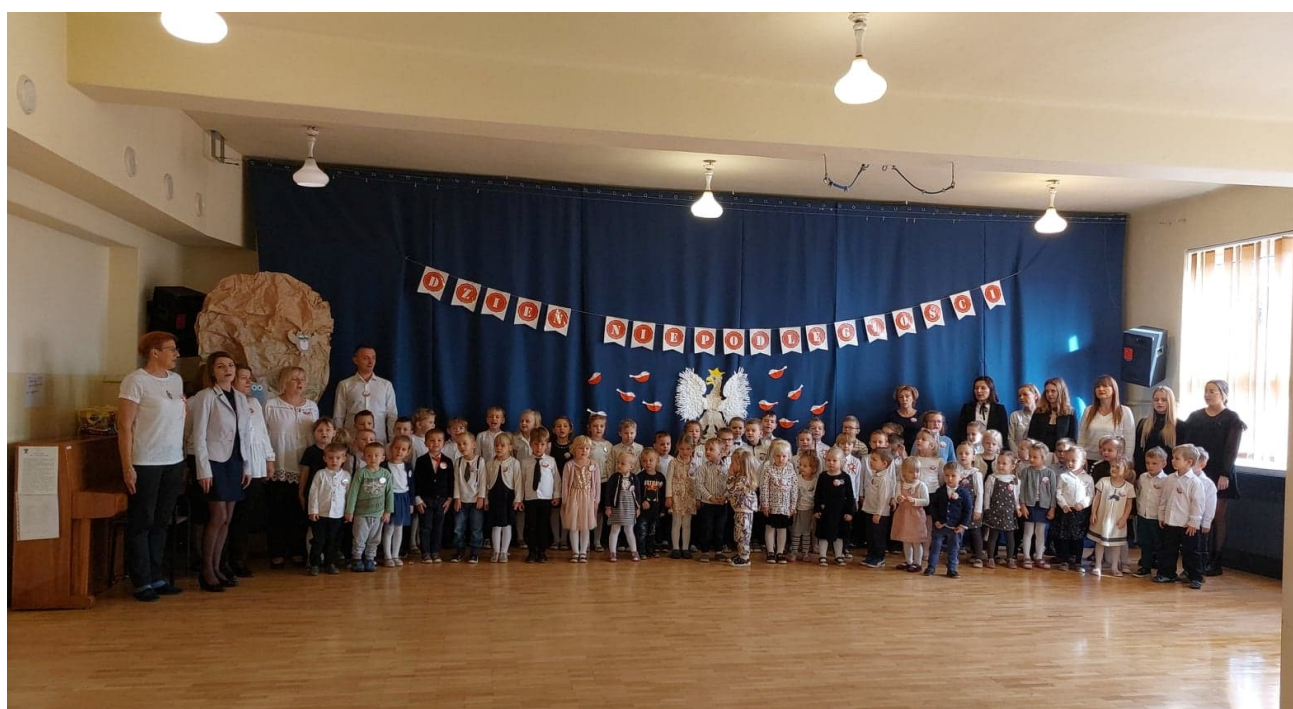
Grupowe zdjęcia z przedszkolakami.