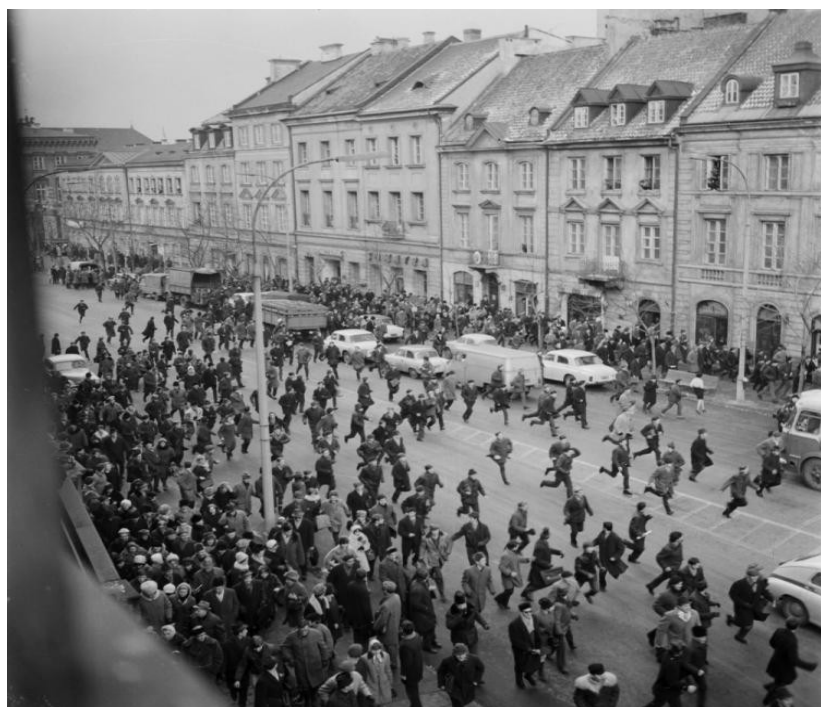
Warszawa, 8 marca 1968 r. Uczestnicy wiecu na UW zaatakowani na Krakowskim Przedmieściu.

Do końca marca wystąpienia środowisk akademickich zostały stłumione, a ich uczestnicy byli represjonowani, ponad 80 osób skazano w procesach politycznych na kary więzienia. Władze wykorzystały wystąpienia studentów do wzniesienia 11 marca nagonki antyinteligentkiej i antysemitkiej w środkach masowego przekazu, organizowania ataków na osoby protestujące przeciwko represjom wobec studentów czy zwoływania wieców w zakładach pracy dla poparcia polityki PZPR. W samej Warszawie w przeciągu trzech miesięcy (marzec–maj 1968) zwolniono prawie 500 osób, w Łodzi w ciągu 1968–1969 do emigracji zmuszono niemal całe, największe wówczas w Polsce, skupisko Żydów (3,5–4 tys. osób), w tym wielu lekarzy, naukowców, filmow-