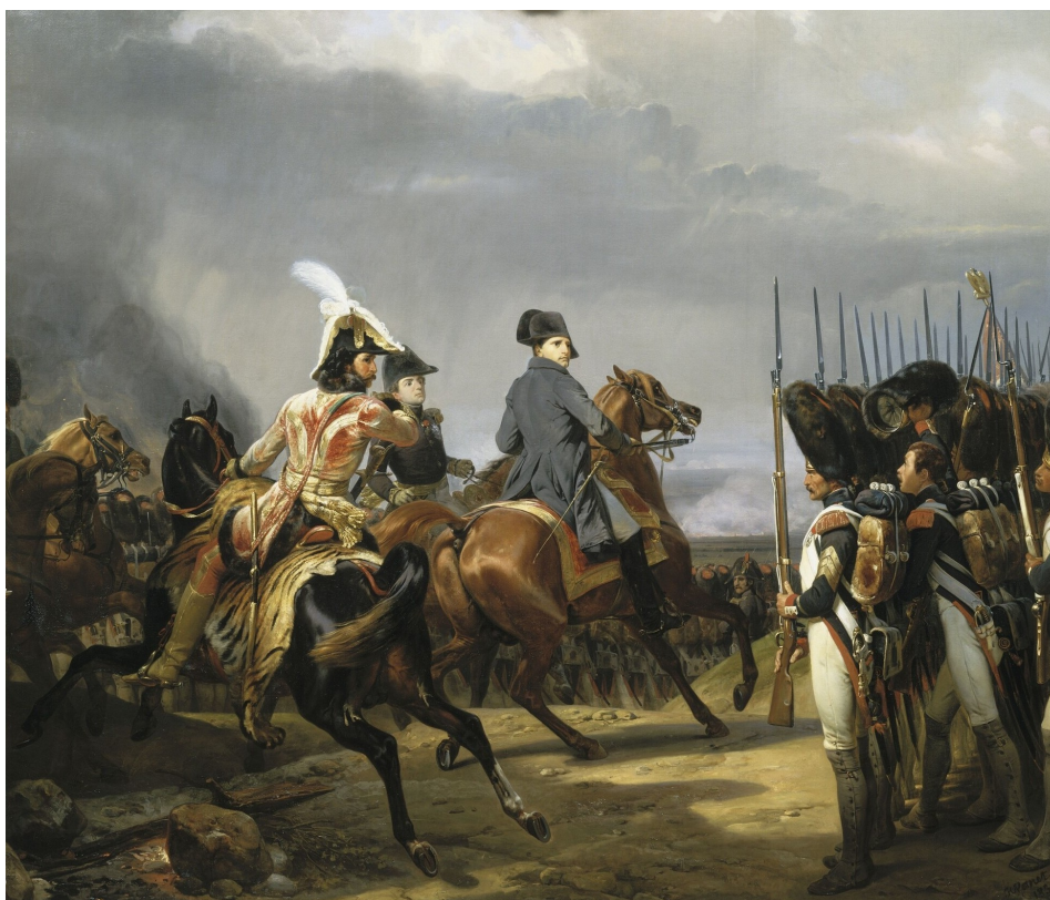
Obraz „Bitwa pod Jeną” Horacego Verneta.

Na początku Cesarz dysponował 48 tysiącami żołnierzy, lecz z biegiem czasu coraz to więcej oddziałów przybywało na pole bitwy, co bardzo zaskoczyło generała Hohenlohe (dysponował siłą 38 tysięcy Prusaków). Pod naporem wojsk francuskich Prusacy zaczęli uciekać, mijając 15 tysięcy idących ich wesprzeć wprost z Weimaru żołnierzy Röchela.